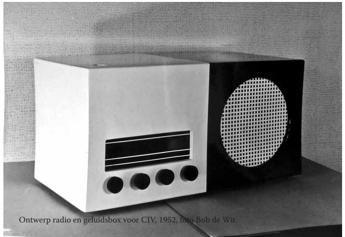
Ontwerp radio en geluidsbox voor CIV, 1952