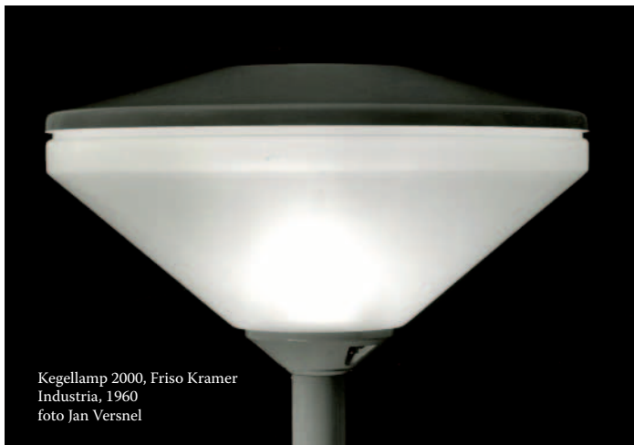
Kegellamp 2000, Friso Kramer Industria, 1960

“Toen ik in de zestiger jaren les ging geven op de Cursus Industriële Vormgeving vond ik dat deze studenten teveel het bos in werden gestuurd. Het was regel om gekke stroomlijnvormen te maken. Mijn wijze van lesgeven was dan ook om de studenten – die naast hun studie al een baan hebben – bij te spijkeren. Ik heb moeite met het huidige Dutch Design. Want ik heb huiver voor het op de eigen schouder kloppen. Men probeert er een mondiaal begrip van te maken. Het belangrijkste aan een goed ontwerp is toch dat je er op de lange termijn geen last van hebt! Als je alleen vanuit eigen vormlust aan de slag gaat wordt het ontwerp uiteindelijk maar een onbruikbaar, gebrekkig ding. Als dat nodig is moet je je eigen ontwerpen na een langere periode ook durven aanpassen. De Revoltstoel heb ik in 1953 ontworpen. Inmiddels zijn de mensen echter gemiddeld 20-25 centimeter langer geworden. Dus heb ik een aantal jaren geleden het ontwerp aangepast aan deze tijd. Mijn ontwerp voor de Revolt tekentafel en de lantaarnpaal met paalkoparmatuur maken deel uit van het Unesco-werelderfgoed. Daar ben ik erg trots op”