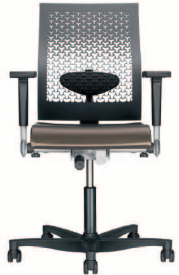
Ahrend 250, Frans de la Haye Ahrend, 2006

Bijzonder: Studeerde af in de roerige jaren zestig, en weigerde zijn diploma aan te nemen.